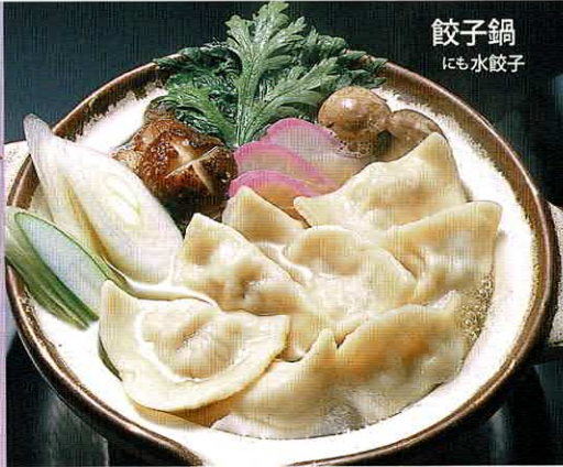
餃子鍋 にも水餃子

■調理法は、 チョー簡単 冷凍のまま グツグツ煮 えたお鍋の 中に入れる だけ。